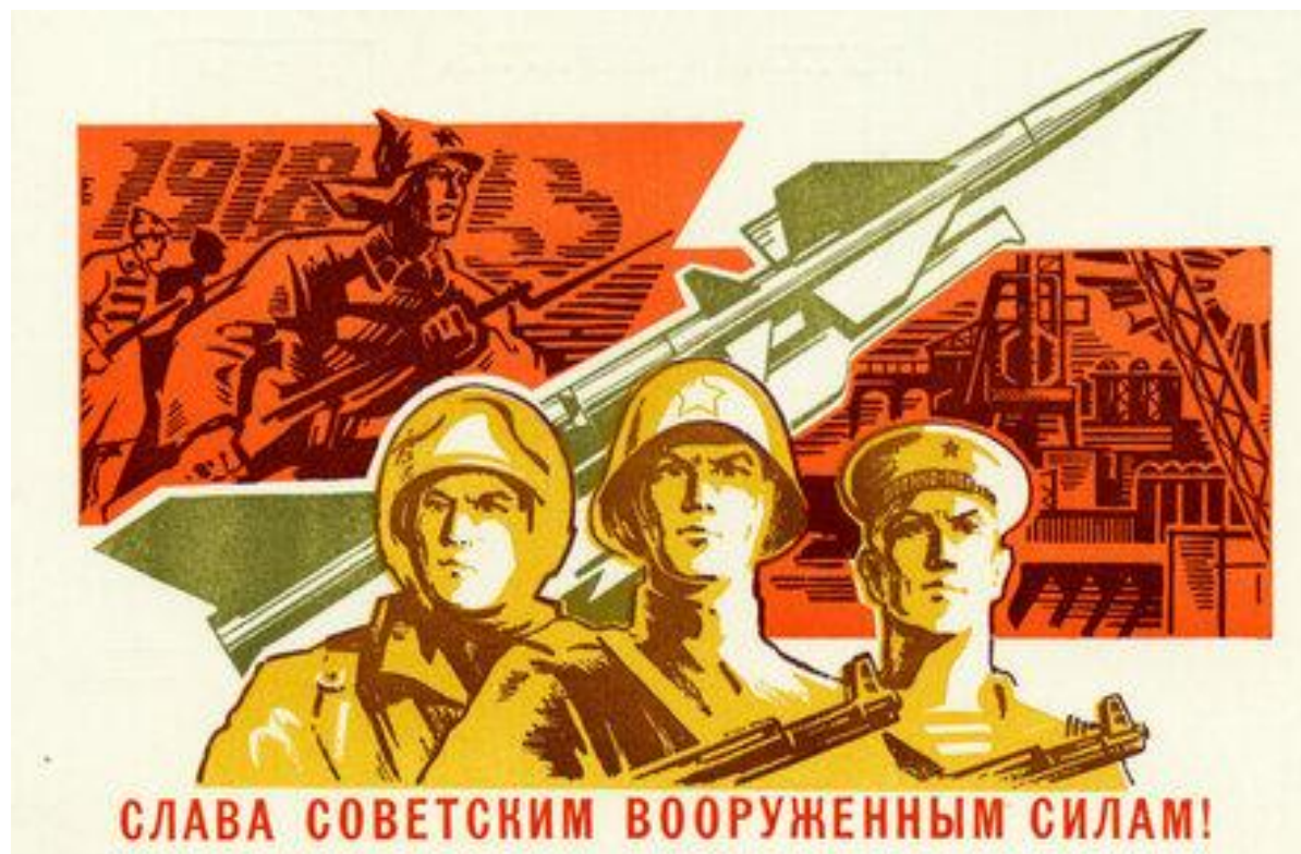
открытка советского образца