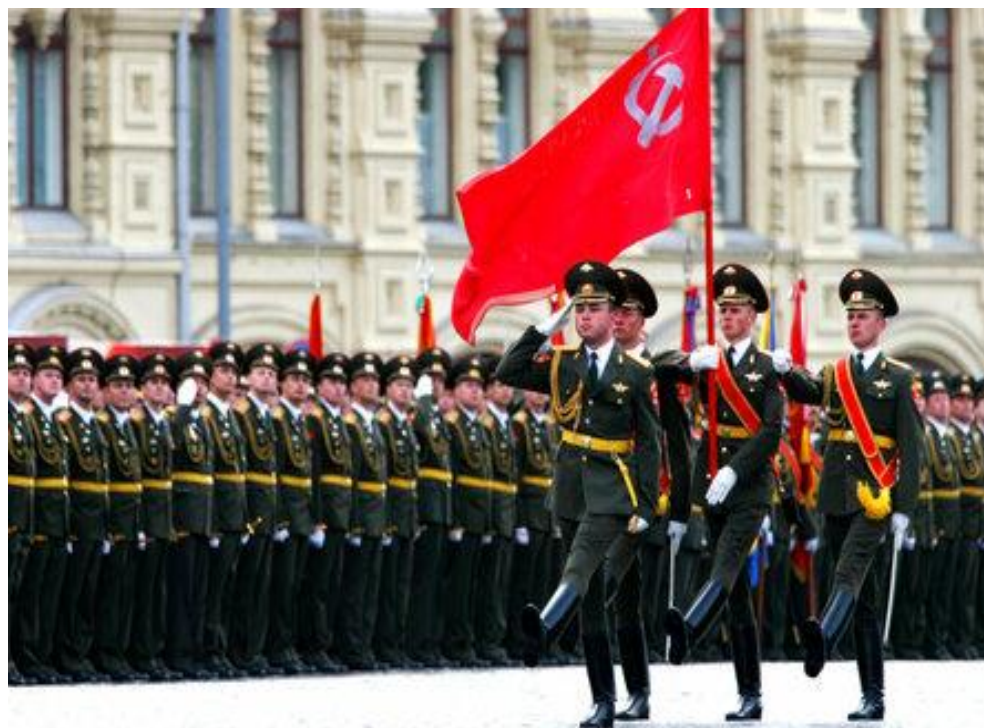
Рота почетного караула

Интересный факт: согласно опросу граждан, проведенному в 2013 году, 77% из них уверены в важности и значимости Дня защитника Отечества.